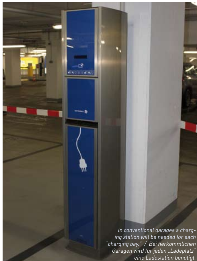
Otto Wöhr GmbH

Ist man glücklicher Fahrer eines umweltfreundlichen Elektroautos und will während des Parkens in der Stadt auch laden, muss erst einmal ein Stellplatz mit Ladestation gefunden werden. Sind die wenigen „Ladeplätze“ im Parkhaus bereits belegt – im schlimmsten Fall sogar von Fahrzeugen mit Verbrennungsmotor, die ohne Beachten der Beschilderung